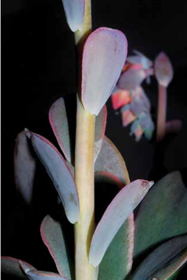
FOTO 5. Detalle de las hojas del tallo floral de Echeveria guerrerensis .