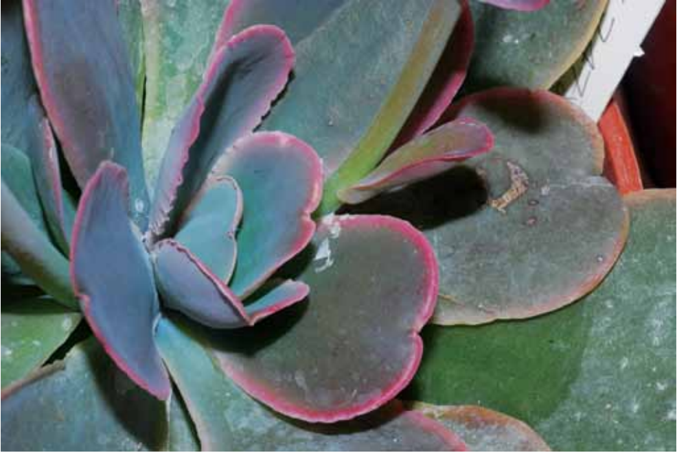
FOTO 1. Detalle de las hojas obcordadas de Echeveria guerrerensis de color verde azulado y bordes rosados.