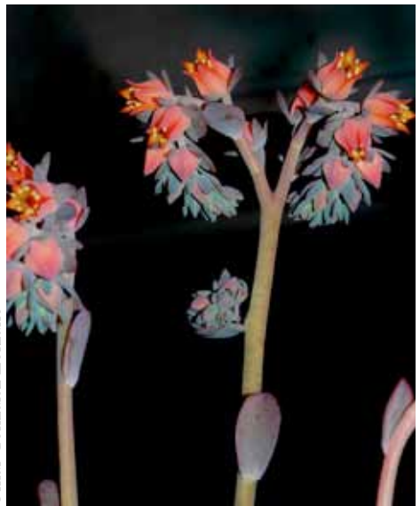
FOTO 4. Inflorescencia de Echeveria guerrensis .

Se estudiaron las estructuras florales de manera exhaustiva y después de la revisión bibliográfica, se llegó a la conclusión de que