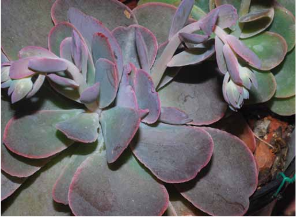
FOTO 3. Rosetas de Echeveria guerrensis .