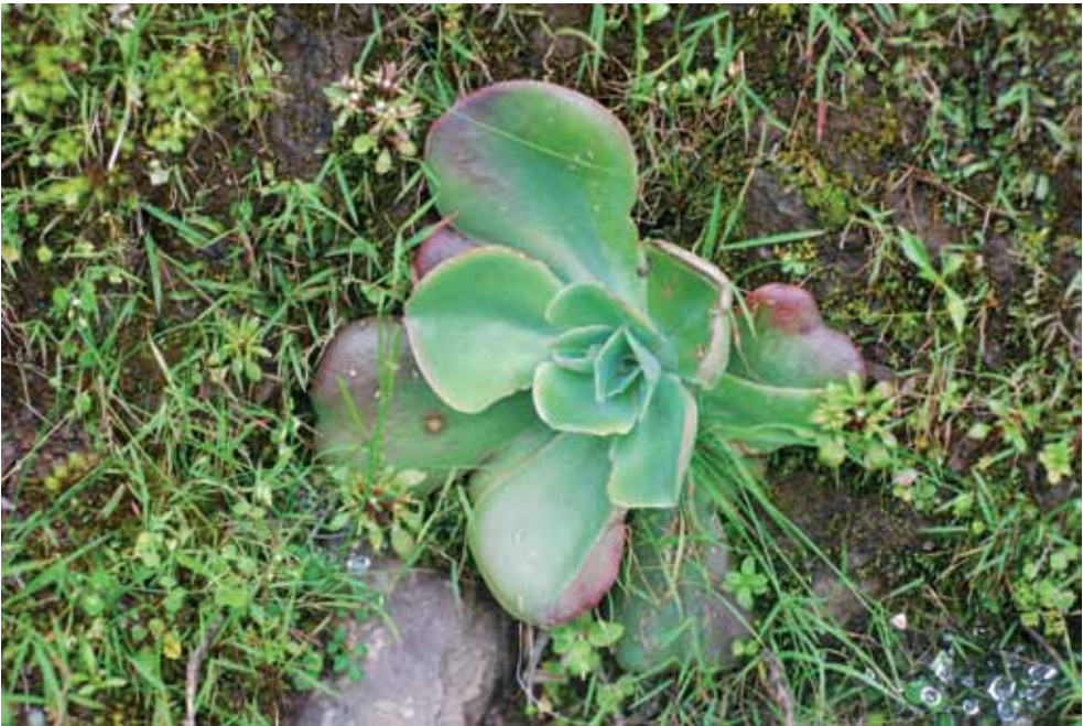
FOTO 2. Echeveria guerrerensis creciendo en hábitat en la localidad de Toro Muerto, Guerrero.